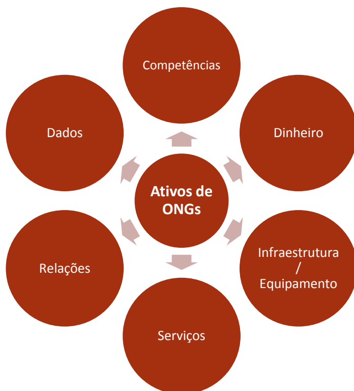
Figura 1 Ativos das ONGs

Uma revisão sistemática dos recursos relevantes das ONGs para prontidão para emergências e desastres agrupou os ativos das ONGs em cinco categorias (Figura 1). Em última análise, eles podem ser usados para avaliar a disponibilidade de ONGs nos níveis nacional, estadual e local (Acosta 2013).